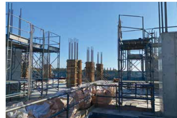
型枠大工の技能が建物や構造物の素顔になってそのまま現れます。

鉄筋コンクリートの建物（RC造）は、まだ軟らかいコンクリートを建物の形の「枠」に流し込んで、その形に固まらせてつくります。このコンクリートの形を決める枠を「型枠」と呼びます。そして、その「型枠」をつくり込む仕事が型枠大工工事です。対象となるのは、アパート、マンション、学校、米軍基地の体育館や宿舎など、コンクリートがある建築物すべてが、私たちのフィールドです。コンクリートは固まったら元に戻らないので、失敗するとやり直しが利きません。型枠大工の責任は重大です。その分、やりがいも大きく達成感もあります。